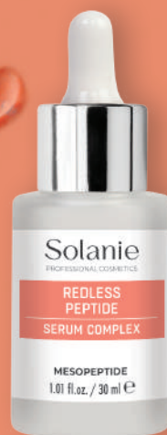
SO11223 | Redless Peptid serum complex Telangyn® • Rubixyl® • Neodermyl®