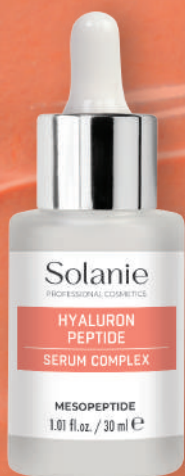
SO11224 | Hyaluron Peptid serum complex Leuphasyl® • Rubixyl® • Neodermyl®