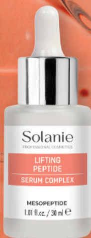
SO11221 | Lifting Peptid serum complex Matrixyl 3000® • Neodermyl®