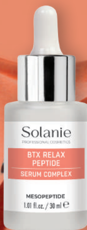
SO11225 | BTX Relax Peptid serum complex Argireline® • Leuphasyl® • Neodermyl®